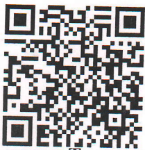
ГРАФИК ПЛАТЕЖЕЙ* к договору (контракту) от 10.01.2022 г. № 0004337

между Тоза худуд ДУК и Янгиер шаҳар Ижтимоий фанларни чуқур урганишга ихтисослаштирилган мактаб-интернати на общую сумму 1614600,00