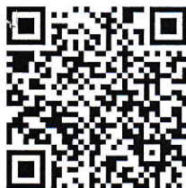
ГРАФИК ПЛАТЕЖЕЙ* к договору (контракту) от 19.01.2022 г. № 071455

между Конликул тумани РЭС и КР Конликул тумани Молия булими на общую сумму 1289700,00