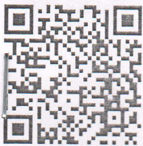
ГРАФИК ПЛАТЕЖЕЙ* к договору (контракту) от 20.01.2022 г. № 228

между Дехконобод туман Электр тармоклари и Дехконобод тумани тиббиёт коллежи на общую сумму 10498950,00