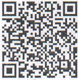
ГРАФИК ПЛАТЕЖЕЙ* к договору (контракту) от 19.01.2022 г. № 08_4489/348

между О'ЗВЕКТЕЛЕКОМ и Сирдарё туман Санитария-эпидемиологик осойишталик маркази на общую сумму 1650000,00