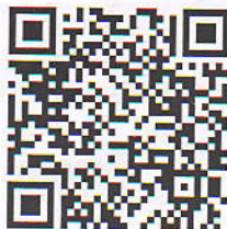
ГРАФИК ПЛАТЕЖЕЙ* к договору (контракту) от 18.01.2022 г. № 1206

между Нукус сахар КЭТ и КР Давлат архитектура ва курилиш кумитаси на общую сумму 4320000,00