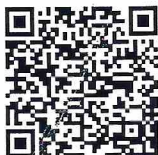
ГРАФИК ПЛАТЕЖЕЙ* к договору (контракту) от 17.01.2022 г. № 1964-2022/ЛРО

между ООО "UNICON-SOFT" и Ўзбекистон Республикаси Бандлик ва меҳнат муносабатлари вазирлиги на общую сумму 27199200,00