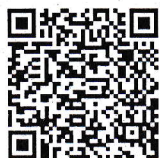
ГРАФИК ПЛАТЕЖЕЙ* к договору (контракту) от 10.01.2022 г. № 14-10/0571100000115

между Узагротсугурта ДАСК и Коракалпогистон Республикаси Давлат солик бошкармаси на общую сумму 360000,00