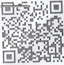
ГРАФИК ПЛАТЕЖЕЙ* к договору (контракту) от 05.01.2022 г. № 10

между "Tasty-Milk" МЧЖ и Тошкент вилояти Кичкинтой болалар уйи на общую сумму 4183000,00