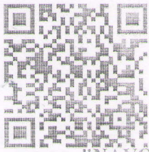
ГРАФИК ПЛАТЕЖЕЙ* к договору (контракту) от 24.01.2022 г. № 18

между "NAVOIY NEFT BAZASI" mas'uliyati cheklangan jamiyati и Қизилтепа тумани ҳокимлиги на общую сумму 4386791,41