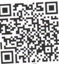
ГРАФИК ПЛАТЕЖЕЙ* к договору (контракту) от 24.01.2022 г. № 1307

между Бухоро шахар Электр тармоқлари и Бухоро шахар 2-сон болалар-усмирлар спорт мактаби на общую сумму 652950