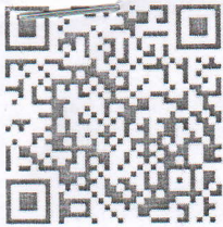
ГРАФИК ПЛАТЕЖЕЙ* к договору (контракту) от 24.01.2022 г. № 40928328

между О'ЗБЕКТЕЛЕКОМ и Тайлок туман МТБ на общую сумму 34400000,00