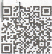
ГРАФИК ПЛАТЕЖЕЙ* к договору (контракту) от 20.01.2022 г. № 14/22

между "Агрозооветсервис" МЧЖ и Янгийул туман Ветеринария булими на общую сумму 3312000,00