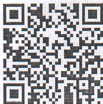
ГРАФИК ПЛАТЕЖЕЙ* к договору (контракту) от 24.01.2022 г. № 040094

между Сирдарё тумани Электр тармоқлари корхонаси и Сирдарё туман Санитария-эпидемиологик осойишталик маркази на общую сумму 3999960,00