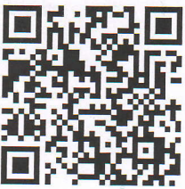
ГРАФИК ПЛАТЕЖЕЙ* к договору (контракту) от 05.01.2022 г. № 60

между О'ЗВЕКТЕЛЕКОМ и РШТЁИМ Бухоро филиали на общую сумму 720000,00