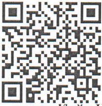
ГРАФИК ПЛАТЕЖЕЙ* к договору (контракту) от 24.01.2022 г. № 21-0177

между Кийи Чирчик Электр тармоклари и Куйичирчик туман 2-сон касб-хунар мактаби на общую сумму 999900,00