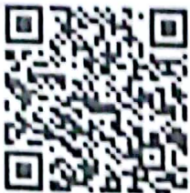
ГРАФИК ПЛАТЕЖЕЙ* к договору (контракту) от 10.01.2022 г. № 1

между СИРДАРЕ МАТБУОТ ХИЗМАТ МЧЖ и Ширин шаҳар Маданият булими на общую сумму 6000000,00