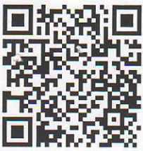
ГРАФИК ПЛАТЕЖЕЙ* к договору (контракту) от 19.01.2022 г. № 1

между ООО Табасум Нукус и Нукусский транспортный техникум на общую сумму 264562632,00