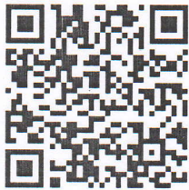
ГРАФИК ПЛАТЕЖЕЙ* к договору (контракту) от 17.01.2022 г. № 090076/1

между Сайхунобод туман Электр тармоклари корхонаси и Сайхунобод тумани Тиббиёт бирлашмаси на общую сумму 8999991,00