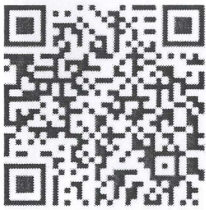
ГРАФИК ПЛАТЕЖЕЙ* к договору (контракту) от 05.01.2022 г. № 171332

между Турткул туман РЭС и OSD Qoraqalpog'iston Res. hududiy bo'limi на общую сумму 2700000,00