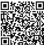
ГРАФИК ПЛАТЕЖЕЙ* к договору (контракту) от 19.01.2022 г. № 12_27912/2140

между O'ZBEKTELEKOM и Учкудук Болалар мусика ва санъат мактаби на общую сумму 720000,00