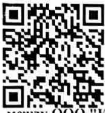
ГРАФИК ПЛАТЕЖЕЙ* к договору (контракту) от 14.01.2022 г. № 56

между ООО "Каракалпак Дари-Дармак" и Коракалпоғистон Республикаси Худудий Перинттал маркази на общую сумму 88418,00