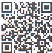
ГРАФИК ПЛАТЕЖЕЙ* к договору (контракту) от 17.01.2022 г. № 090076/2

между Сайхунобод туман Электр тармоклари корхонаси и Сайхунобод тумани Тиббиёт бирлашмаси на общую сумму 14999998,50