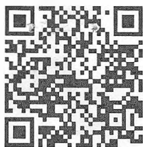
ГРАФИК ПЛАТЕЖЕЙ* к договору (контракту) от 05.01.2022 г. № 88