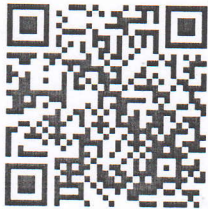
ГРАФИК ПЛАТЕЖЕЙ* к договору (контракту) от 17.01.2022 г. № 090076/3

между Сайхунобод туман Электр тармоклари корхонаси и Сайхунобод тумани Тиббиёт бирлашмаси на общую сумму 14999998,50