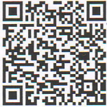
ГРАФИК ПЛАТЕЖЕЙ* к договору (контракту) от 26.01.2022 г. № 04-05/0091111323402

между НКЭИС "Узбекинвест" и Жанубий Мирзачул магистрал канали бошкармаси на общую сумму 16982000,00