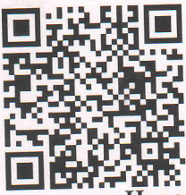
ГРАФИК ПЛАТЕЖЕЙ* к договору (контракту) от 18.01.2022 г. № 22/22

между Навоий шаҳар Эл тармоклари и Навоий шаҳар Ветеринария ва чорвачиликни ривожлантириш бўлими на общую сумму 2999970,00