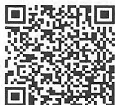
ГРАФИК ПЛАТЕЖЕЙ* к договору (контракту) от 12.01.2022 г. № 5426

между O'zR Milliy gvardiyasi Toshkent shahar qo'riqlash boshqarmasi и УзР Судьялар олий кенгаши на общую сумму 125 936 640