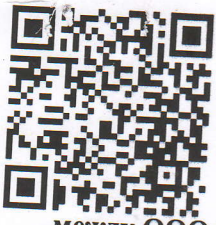
ГРАФИК ПЛАТЕЖЕЙ* к договору (контракту) от 25.01.2022 г. № 23

между ООО "Болат капитал сервис" и Центр реабилитации и протезирование инвалидов РК на общую сумму 14040000,00