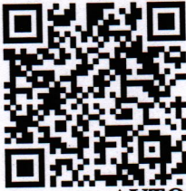
ГРАФИК ПЛАТЕЖЕЙ* к договору (контракту) от 24.01.2022 г. № 2

между AVTO BUNKER TORG SERVIS и Угом Чоткол Давлат миллий табиат боги бошкармаси на общую сумму 15000000,00