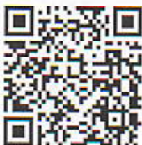
ГРАФИК ПЛАТЕЖЕЙ* к договору (контракту) от 24.01.2022 г. № 23

между O'ZBEKTELEKOM и Олтинсой туман 1-сон касб-хунар мактаби на общую сумму 2400000,00