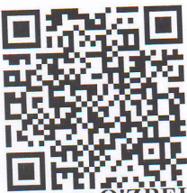
ГРАФИК ПЛАТЕЖЕЙ* к договору (контракту) от 20.01.2022 г. № 40322727

между O'ZBEKTELEKOM и Санитария эпидемиологик осойишталик ва Жамоат саломатлиги бошкармаси Гулистон туман бўлими на общую сумму 720000,00