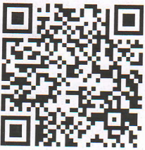
ГРАФИК ПЛАТЕЖЕЙ* к договору (контракту) от 24.01.2022 г. № 6-КРВ

между "NAV-CLEAN CITY" МЧЖ и Қизилтепа туман ХТБ на общую сумму 325450,00