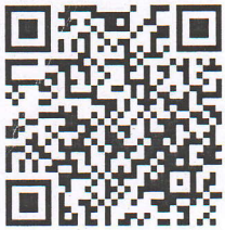
ГРАФИК ПЛАТЕЖЕЙ* к договору (контракту) от 24.01.2022 г. № 067-ТТ

между "SRB MED" МЧЖ и РШТЁИМ Бухоро филиали на общую сумму 37618200,00