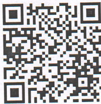
ГРАФИК ПЛАТЕЖЕЙ* к договору (контракту) от 24.01.2022 г. № 111

между ООО "DELPHARM и РШТЁИМ Бухоро филиали на общую сумму 34847192,10