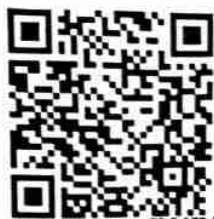
ГРАФИК ПЛАТЕЖЕЙ* к договору (контракту) от 13.01.2022 г. № 5

между RUDI PHARM ЖЧЖ и Коракалпоғистон Республикаси Худудий Перинитал маркази на общую сумму 1081000,00