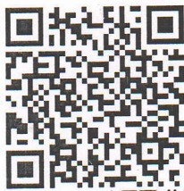
ГРАФИК ПЛАТЕЖЕЙ* к договору (контракту) от 11.01.2022 г. № 102181

между АТП "Олмазор-Махсустранс" и Ислом Каримов номидаги ТДТУ академик лицейи на общую сумму 299868,33