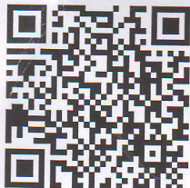
ГРАФИК ПЛАТЕЖЕЙ* к договору (контракту) от 14.01.2022 г. № 58 /БЮД

между Бухоро вилоят "Сувокова" ДУК и Когон Педагогика коллежи на общую сумму 1398930,00