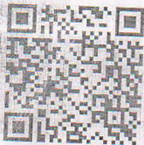
ГРАФИК ПЛАТЕЖЕЙ* к договору (контракту) от 07.01.2022 г. № 21

между "Сирдарё сув таминоти" МЧЖ Сирдарё т филиали и Сирдарё туман хокимлиги на общую сумму 447525,00