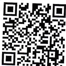
ГРАФИК ПЛАТЕЖЕЙ* к договору (контракту) от 14.01.2022 г. № 15

между "Коракул Метан Газ -Сабрия" МЧЖ и Коракул туман Махалла ва оилани куллаб кувватлаш булими на общую сумму 1500000,00