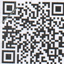
ГРАФИК ПЛАТЕЖЕЙ* к договору (контракту) от 12.01.2022 г. № 0001206

между Тоза худуд ДУК и Околтин туман ХТБ на общую сумму 828000,00