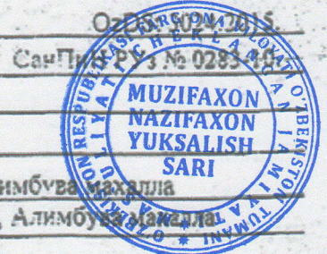
Схема сертификации: № 3

соответствует требованиям нормативной документации