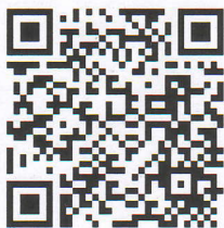
ГРАФИК ПЛАТЕЖЕЙ* к договору (контракту) от 10.01.2022 г. № 82

между ООО "INSEP" и Тошкент вилояти тери-таносил касалликлари дипансери на общую сумму 2893673,00