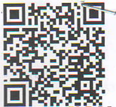
ГРАФИК ПЛАТЕЖЕЙ* к договору (контракту) от 13.01.2022 г. № 66

между УзР Миллий гвардияси Қорақалпоғистон Республикаси Қуриқлаш бошқармаси и У.Халмуратов номидаги Республика қуп тармоқли тиббиёт маркази на общую сумму 14228766,00