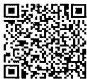
ГРАФИК ПЛАТЕЖЕЙ* к договору (контракту) от 11.01.2022 г. № 5660

между ОАО "Таш ГОР ПЭС" Миробод ТЭТ и УзР Судьялар олий кенгаши на общую сумму 6 598 800