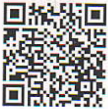
ГРАФИК ПЛАТЕЖЕЙ* к договору (контракту) от 27.01.2022 г. № 1/01

между "SHOX-BEK SHOR" МЧЖ и Олгинсой туман МТБ на общую сумму 76050000,00