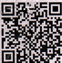
ГРАФИК ПЛАТЕЖЕЙ* к договору (контракту) от 20.01.2022 г. № 130031/4

между Оккургон Электр тармоклари и Туман тиббиет бирлашмаси на общую сумму 1499985,00