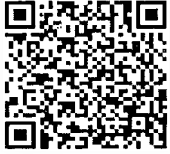
ГРАФИК ПЛАТЕЖЕЙ* к договору (контракту) от 10.01.2022 г. № Call-1016

между АК "Узбектелеком" "Сотув ва хизмат кўрсатиш маркази" ва УзР Судьялар олий кенгаши на общую сумму 4682550