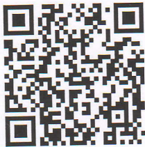
ГРАФИК ПЛАТЕЖЕЙ* к договору (контракту) от 28.01.2022 г. № 5

между Ноји мчж и Тошкент вилояти болалар ва усмирлар футбол академияси на общую сумму 2550000,00