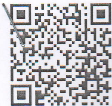
ГРАФИК ПЛАТЕЖЕЙ* к договору (контракту) от 27.01.2022 г. № 28

между "BASFARM" МСНЖ и Бухоро туман ХТБ на общую сумму 14999878,00