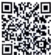
ГРАФИК ПЛАТЕЖЕЙ* к договору (контракту) от 24.01.2022 г. № 3

между ООО "STROY IDEAL INVEST" и Бекобод туман КФБ ободонлаштириш булими на общую сумму 5999600,00